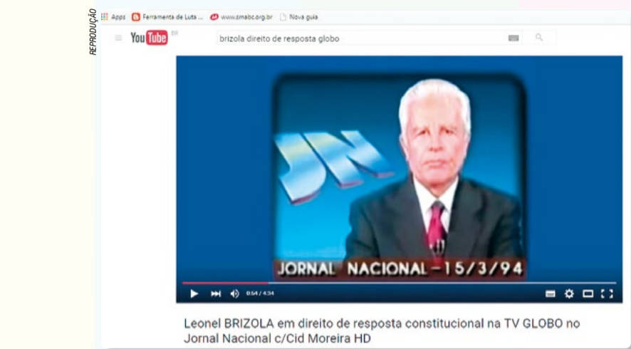
Em março de 94, uma decisão inédita da justiça obrigou a TV Globo a ler o direito de resposta de Leonel Brizola, após ter ofendido o político no Jornal Nacional

Para a imprensa escrita ou internet, a resposta deverá ter o mesmo tamanho e as mesmas características da matéria considerada ofensiva. No rádio ou TV, é exigida a mesma duração e alcance. A lei estabelece prazo de 60 dias, a partir da publicação da notícia, para que o pedido de resposta seja formalizado. Após o pedido,