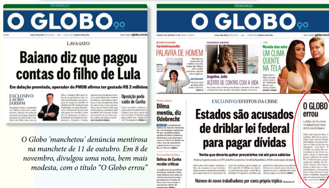
O Globo 'mancheteu' denúncia mentirosa na manchete de 11 de outubro. Em 8 de novembro, divulgou uma nota, bem mais modesta, com o título "O Globo errou"

o canal de comunicação terá o prazo de sete dias para publicá-lo. Rafael citou o recente caso